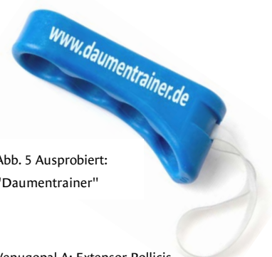
Abb. 5 Ausprobiert: "Daumentrainer"

3: Kräftigen Sie die Ihre Daumenmuskulatur gezielt. Überlastet sind fast immer die Spreiz- und Strecksehnen des Daumens. Genau diese Sehnen und Muskeln können Sie mit Hilfe von Gummibändern oder eines Daumentrainers gezielt trainieren. Aber aufgepasst! Der Daumen muss beim Daumentraining wie beim Daumen-Rodeo richtig im Sattel sitzen. Und zweitens: Bestehen bereits Schmerzen im Bereich von Daumen und Handgelenk muss das Training entsprechend angepasst und niedrig dosiert werden. Einen kranken Cowboy setzt man nicht aufs wildeste Pferd!