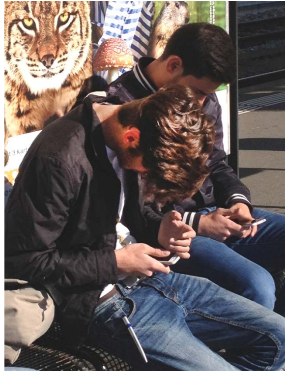
Abb. 1 So nicht: Daumen flach und Rundrücken

Die medizinischen Fakten: Jeder Fünfte hat Probleme - meist am Daumen. Untersucht wurden vor einem halben Jahr 1500 Studenten - zwischen 18-29 Jahren. Frage: Was denken Sie, wie viele SMS pro Tag verschickt der durchschnittliche Student? In der Gruppe mit Beschwerden waren es durchschnittlich 55 pro Tag, in der Gruppe ohne Beschwerden 15 pro Tag. SMS-Champions bringen es locker auf über 200 Nachrichten pro Tag. Auf einer Schmerzskala von 0-10 wurden die Schmerzen in der Beschwerdegruppe mit 4 angegeben wobei das Spektrum von 1 bis 8 reichte. Fazit: Eine Welle (vielleicht gar ein Tsunami?) von Daumen- und Fingerbeschwerden ist im Anrollen. Andere Studien aus asiatischen Ländern berichten, dass jeder 2. Student unter Schmerzen an Daumen und Handgelenk leidet.