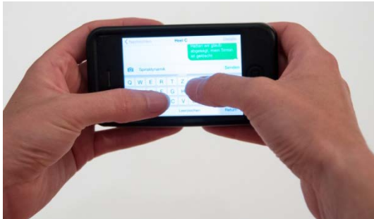
Abb. 4 a-b SMS-Tippen falsch und richtig

Daumen-Rodeo: Es ist genau wie beim Rodeo-Reiten: Der Cowboy muss im Sattel bleiben. Das Daumengrundgelenk ist ein klassisches Sattelgelenk. Das bedeutet: Der Daumen ist der Reiter, die Handwurzel das Pferd. Der «Cowboy» kann sich im Sattel nach vorne beugen und nach hinten strecken; zudem kann er seitlich im Sattel hin und her rutschen, ohne dabei den Kontakt zwischen seinem Hintern und dem zum Sattel zu verlieren. Was nicht geht sind Drehbewegungen. Und genau dies passiert beim Simsen! Der Daumen verliert seine Oppositionsstellung, er sitzt jetzt «schräg und verdreht im Sattel». Beim Cowboy ergibt dies schmerzhafte Druckspitzen zwischen Hintern und Sattel, zudem werden die Zügel asymmetrisch belastet. Beim Sattelgelenk des Daumens ist es analog: Verdrehungen führen zu massiven Druckspitzen des empfindlichen Knorpels; Muskeln und Sehnen werden asymmetrisch und unnatürlich dauerbelastet.